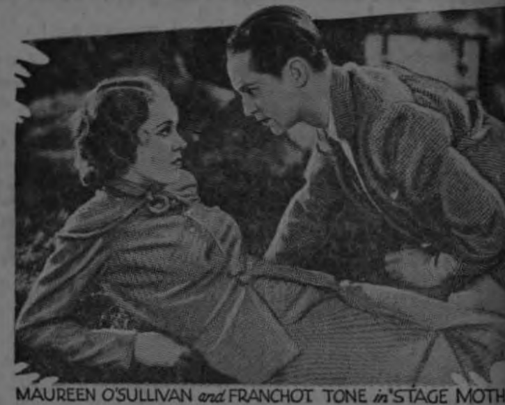
MAUREEN O'SULLIVAN and FRANCHOT TONE in "STAGE MOTHER"

"No se lo digas a mamá", es el magno estreno del domingo en el Teatro Variedades, con las estrellas Franchot Tone y Maureen O. Sullivan. Será un éxito más a los escandalosos éxitos que viene obteniendo el Variedades domingo tras domingo